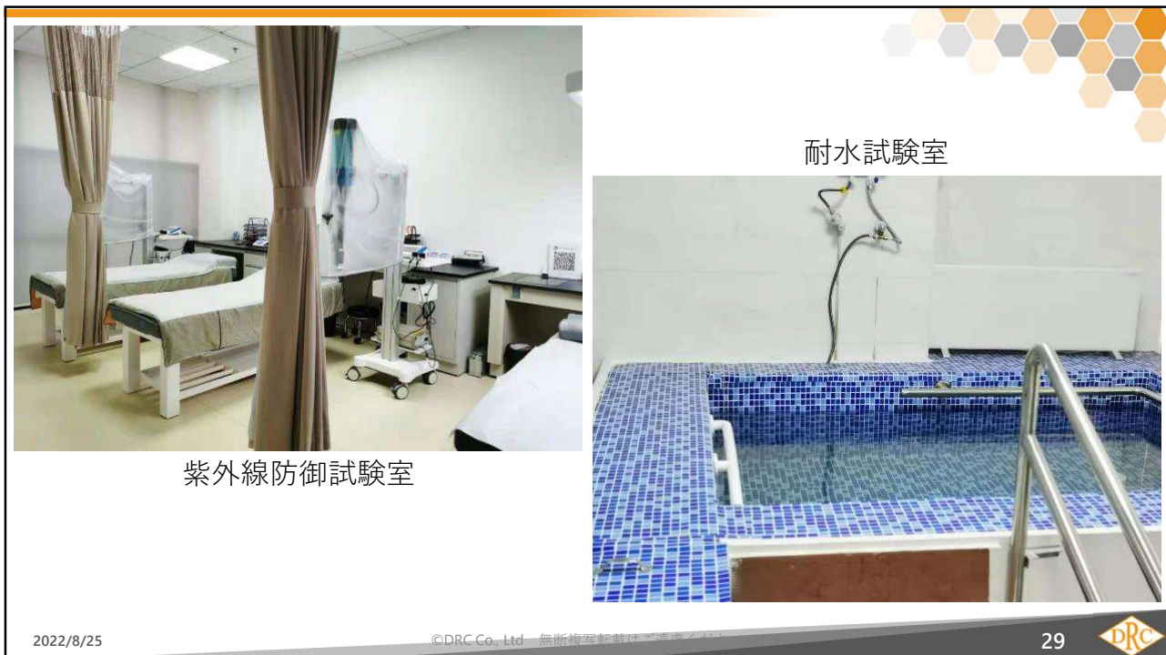
紫外線防御試験室